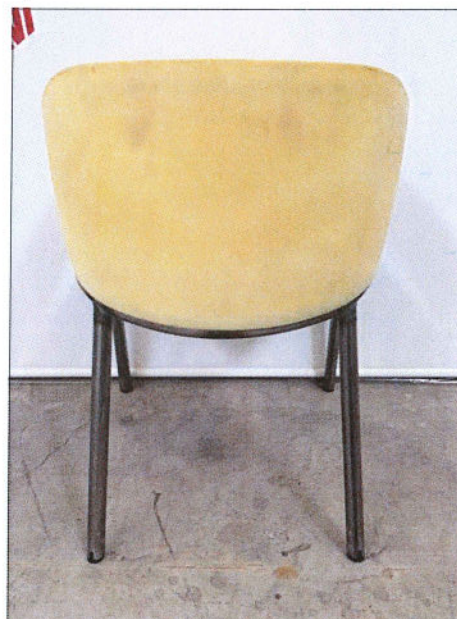
Vista da dietro